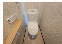
※室内写真は2024年10月撮影