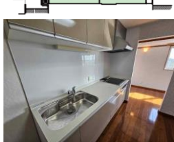
※現況と図面が異なる場合は現況優先