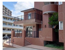
※外観、エントランス写真は2024年7月撮影